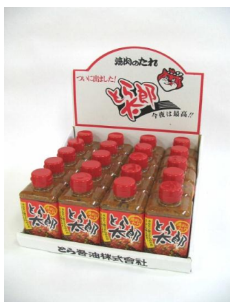
ケース陳列時画像